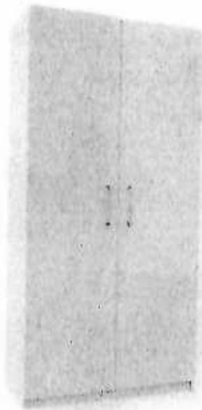
Cristian Arthur Bruck

Confecção de armário para escritório em MDF 18mm, na cor Branco TX, com 2 portas e prateleiras. Nas dimensões de 90 cm de Largura, 1,70 m de altura e 45 cm de profundidade. Orçado no valor de R$ 1.550,00. Modelo conforme foto abaixo: